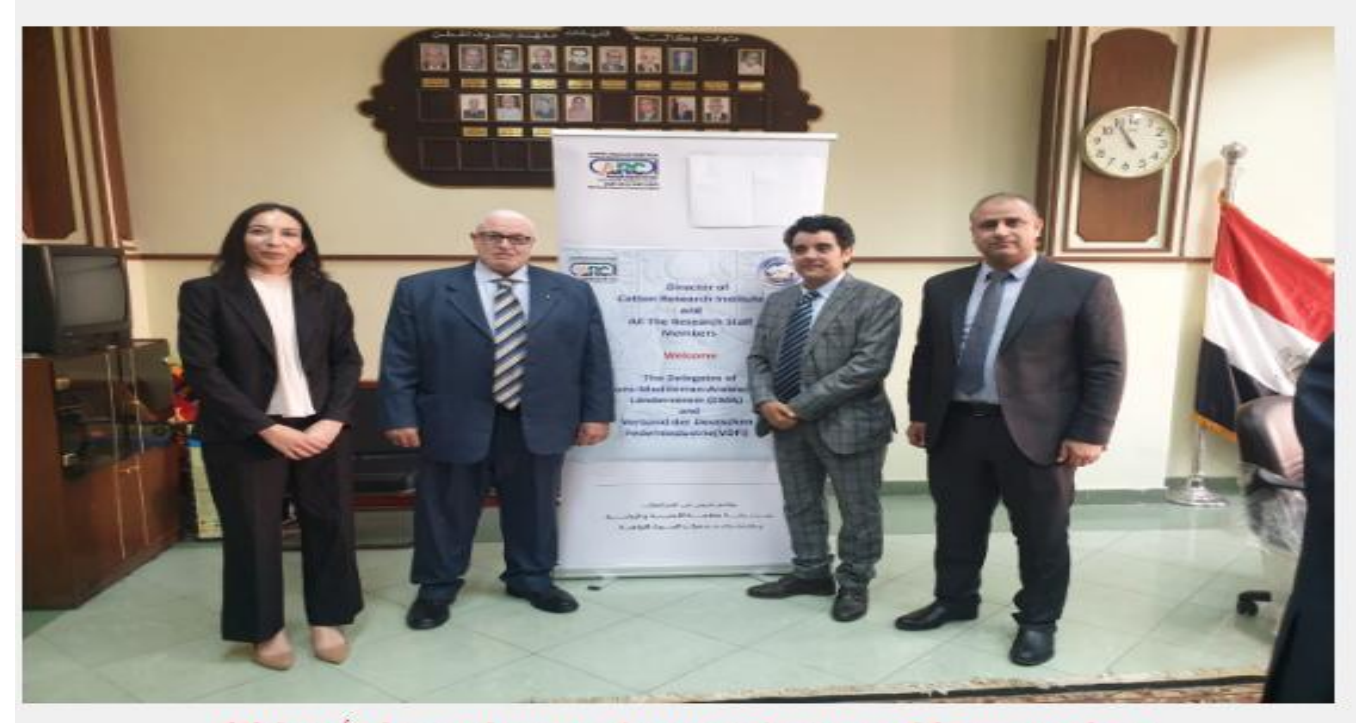
ورشة عمل مشتركة لمعهد بحوث القطن ووفد من رابطة الصناعة الألمانية (3)

يذكر أن اللجنة الوزارية للقطن والتي تضم في عضويتها، السيد القصير وزير الزراعة واستصلاح الأراضي، وهشام توفيق وزير قطاع الأعمال العام، ونيفين جامع وزيرة التجارة والصناعة، عقدت اجتماعًا الشهر الماضى لمتابعة استكمال تنفيذ المنظومة الجديدة للقطن المصري، وذلك بمقر وزارة قطاع الأعمال العام، وأكد وزير قطاع الأعمال العام، مقرر اللجنة، على الجهود المبذولة لتحسين جودة القطن المصري واستعادة مكانته وسمعته المتميزة عالميا، في ظل التعاون والتنسيق المشترك بين الوزارات الثلاث المعنية، لتطبيق استراتيجية النهوض بالقطن المصري والتي تشايب الزراعة والجني ونظام تداول الأقطان لتحفيز المزارعين، وكذلك تطوير المحالي التام العام العام باستخدام تكولوجيا حديثة.