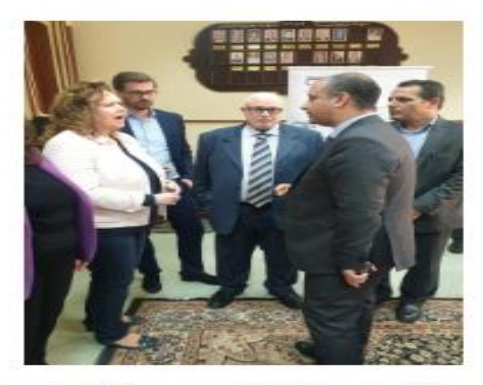
ورشة عمل مشتركة لمعهد بحوث القطن ووفد من رابطة الصناعة الألمانية (1)