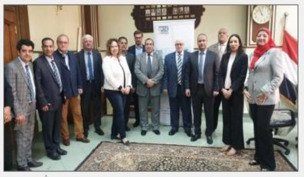
ورشية عمل مشتركة لمعهد بحوث القطن ووفد من رابطة الصناعة الألمانية